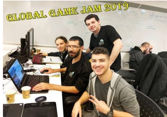
סיכום GGJm מנקודת המבט של עידן לב האתר הראשלצ"י