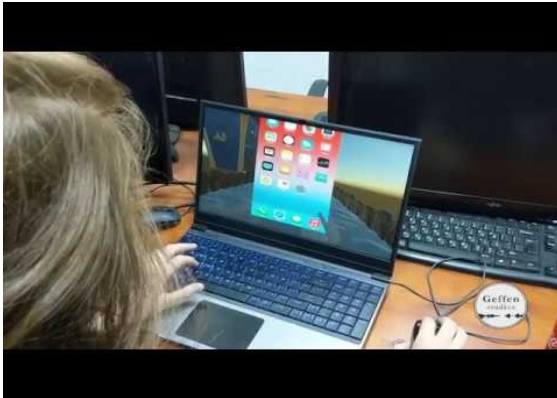
סיכום GGJm מנקודת מבט של מוזיקאי האתר התל אביבי - על ידי Geffen